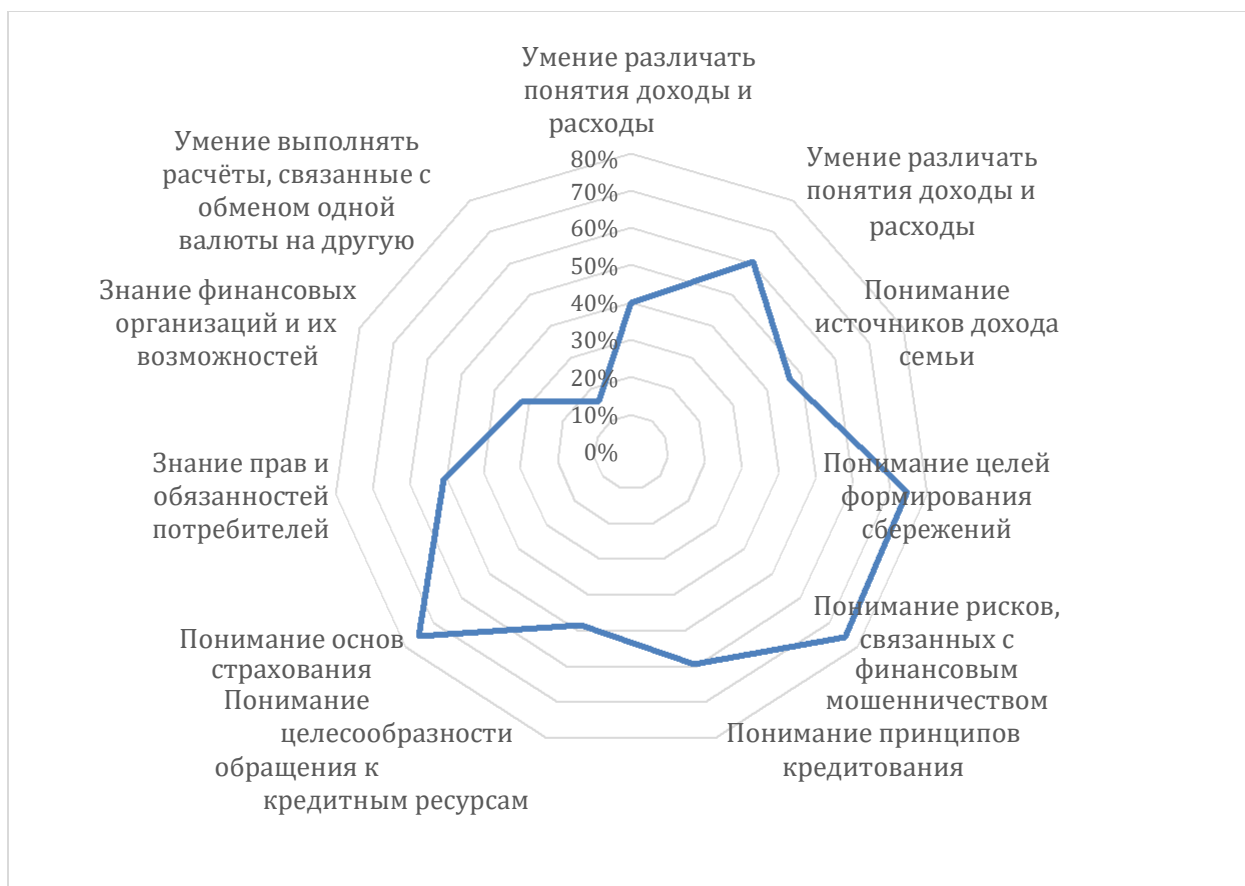
Рисунок 1. Осведомленность по базовым аспектам финансовой грамотности ,7 класс, 2021 г

Общие выводы по результатам мониторинга: